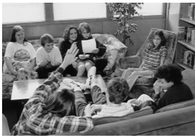
School Meeting in der Cedarwood Sudbury School

In demokratischen Schulen werden alle Angelegenheiten auf der wöchentlichen Vollversammlung (VV) geregelt, bei der jeder Schüler und jeder Lehrer eine Stimme hat. Die VV entscheidet auch über die