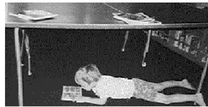
Hier liegen nicht nur Bücher rum

3. Jahr + Vollversammlung entscheidet über alle Personalfragen + demokratisch gewählter Bildungskontrollrat übernimmt Schulaufsicht